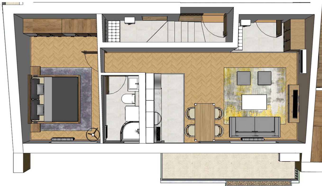
Perspektivni prikaz stana #20